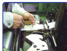
いよいよテープができます！ たくさんのタテの糸に 1本~2本のヨコの糸を絡めることで テープが織れていきます