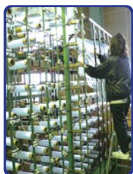
タテの糸をクリルと呼ばれる 棚に1本2kg~5kgも ある糸を1本1本乗せていきます