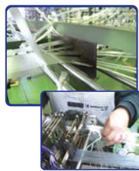
中間機では1本1本の糸を 穴に通し糸が絡まないように 気を付けます