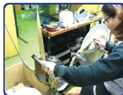
最後にテープを円盤状に仕上げ 検品しながら巻いていきます