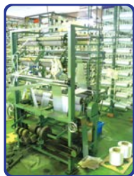
次に中間機と呼ばれる機械に 糸を通します。 テープをきれいに織るために ここで糸のテンションを一定にします